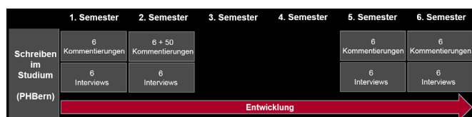
Abb. 3: Forschungsdesign im Überblick

Pro Datenerhebung entstehen jeweils 6 Textkommentierungen und Leitfaden-Interviews. Um das entstehende Analyseraster anhand eines grösseren Korpus verfeinern und das Textkommentierungsverhalten der